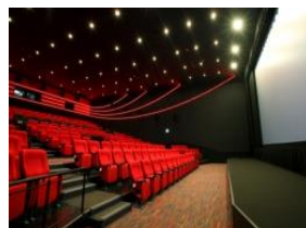
新千歳空港シアター