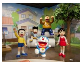
ドラえもん わくわくスカイパーク

2011年7月、「北海道ショールーム」をテーマに商業施設エリアをリニューアルしました。道内各地の特産品や人気の北海道スイーツをはじめ北海道グルメや伝統工芸品など、約180店舗に北海道の魅力を集約しております。また、スイーツや農畜水産品、ラーメンなどの専門店をゾーン展開することにより、回遊性の向上を図っております。更に、他空港にない新たな取り組みとして、大型エンターテインメント施設を展開することにより航空旅客のみならず、地元地域の皆様にも楽しんでいただける時間消費型・滞在型の空港を目指しております。