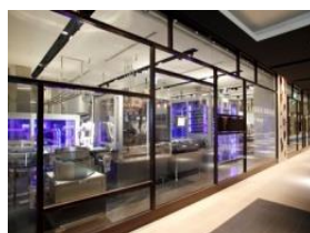
ロイズ チョコレートワールド