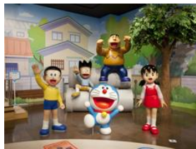
ドラえもん わくわくスカイパーク

2011年7月、「北海道ショールーム」をテーマに商業施設エリアをリニューアルしました。道内各地の特産品や人気の北海道スイーツをはじめ北海道グルメや伝統工芸品など、約180店舗に北海道の魅力を集約しております。また、スイーツや農畜水産品、ラーメンなどの専門店をゾーン展開することにより、回遊性の向上を図っております。更に、他空港にない新たな取り組みとして、大型エンターテインメント施設を展開することにより航空旅客のみならず、地元地域の皆様にも楽しんでいただける時間消費型・滞在型の空港を目指しております。