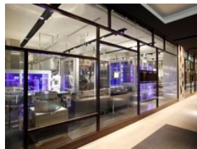
ロイズ チョコレートワールド