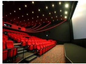
ソラシネマちとせ